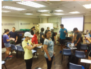
▲ 體適能測試領袖證書