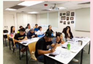
▲ WSET葡萄酒第一級證書

如有興趣參加生活技能培訓課程之運動員可致電2504-8188或WhatsApp 6183-9499 或電郵hkacep@hkolympic.org 與職員查詢。