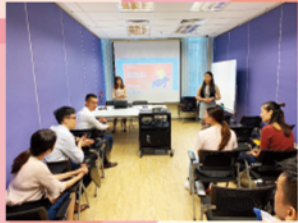
▲ 個人履歷表寫作及面試技巧