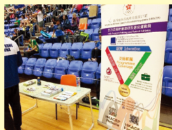
11-12/5/2019 ▶ 第62屆體育節 - 全港藝術體操 分齡賽