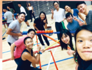
▲ 教練溝通技巧訓練課程