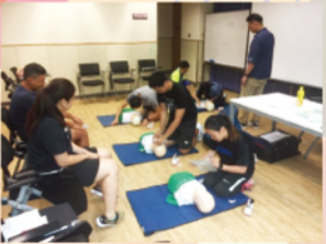
▲ 成人及兒童心肺復甦法及自動體外心臟去纖維性顫動法合併證書課程