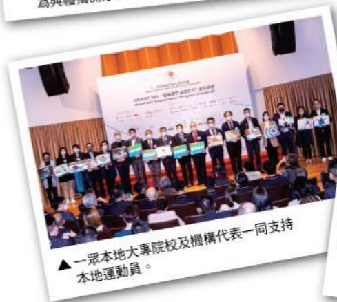
▲ 一眾本地大專院校及機構代表一同支持本地運動員。