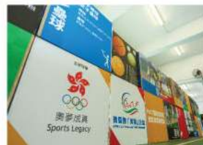
奧林匹克運動展覽及奧運相關擺設