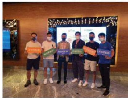
▲ 24/07/2021 「媽媽的神奇小子」運動員優先場