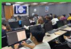
Adobe Illustrator 基礎課程