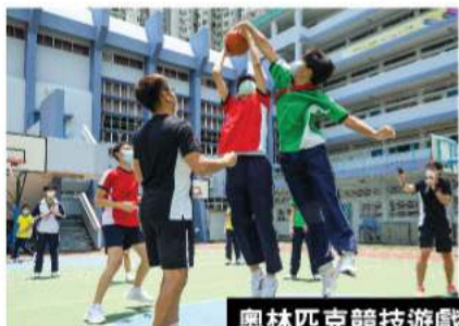
奧林匹克競技遊戲

奧夢成真繼2018至21年後再度獲得香港賽馬會慈善信託基金捐助，於2021至24年延續賽馬會「奧翔」計劃，計劃與數個奧林匹克運動會同步，以運動宣揚奧林匹克價值，預計向 90 間受惠中學推廣具奧林匹克教育作用的競技遊戲，對學生身心發展、社會發展起正面作用；發掘具運動潛質的中學生加以培訓，為本地體壇的發展出一分力；同時為對體育事業感興趣的學生提供「運動相關職業導向」講座，鼓勵學生投身體育行業。計劃活動包括：