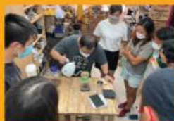
手沖咖啡沖煮工作坊