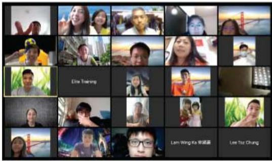
▲ 03/04/2021 香港合球代表隊

本計劃不時會為香港運動員舉辦簡介會及外展宣傳活動，去年，本計劃總共向177位現役或退役運動員介紹HKACEP的服務內容，加深運動員對本計劃的認識。