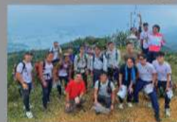
一級山藝訓練證書課程