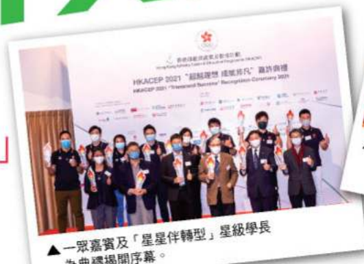
▲ 一眾嘉賓及「星星伴轉型」星級學長為典禮揭開序幕。

去年，香港運動員於東京奧運再創高峰，社會的運動氣氛熾熱。有見及此，HKACEP去年主動邀請不同行業的公司及大專院校，為運動員提供工作機會及實習生計劃，協助運動員發展第二事業。HKACEP亦希望透過本次先導計劃帶來嶄新的效果，令更多社會各界人士於不同層面繼續支持香港運動員。