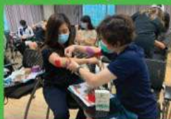
運動貼療法課程 (上半身)