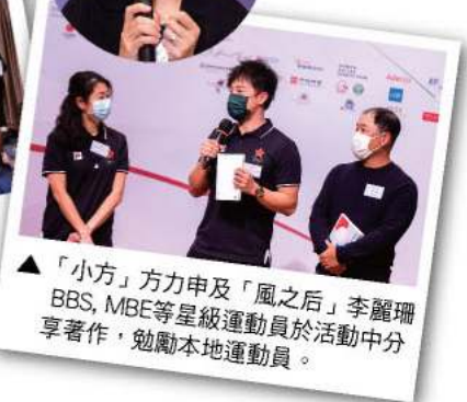
▲ 「小方」方力申及「風之後」李麗珊BBS, MBE等星級運動員於活動中分享著作，勉勵本地運動員。