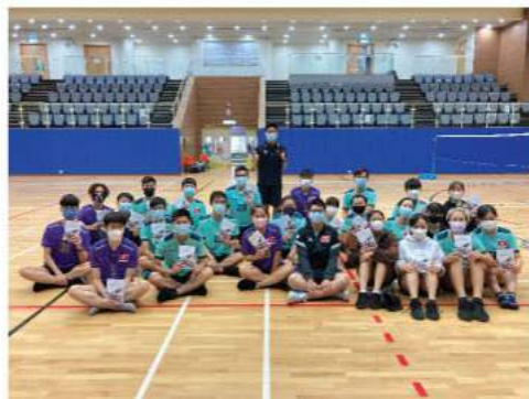
▲ 07/11/2021 香港足球代表隊