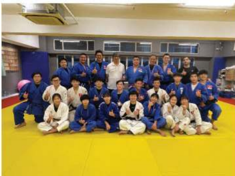
▲ 03/09/2021 香港柔道代表隊