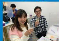
WSET一級葡萄酒 證書課程