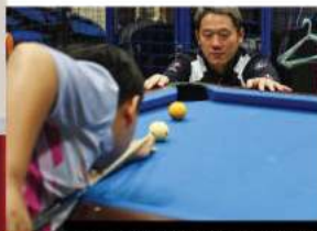
校隊訓練及暑期訓練班 (攝於2019/20學年上學期)