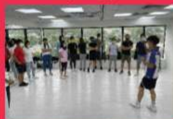
兒童及青少年運動 教練證書課程